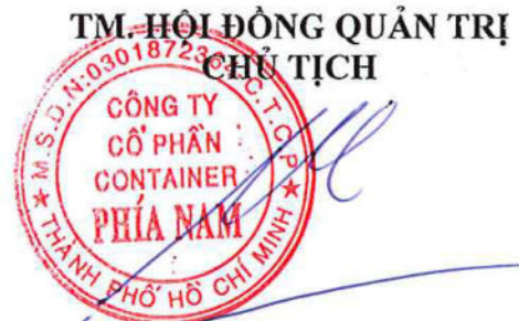
Nguyễn Minh Châu